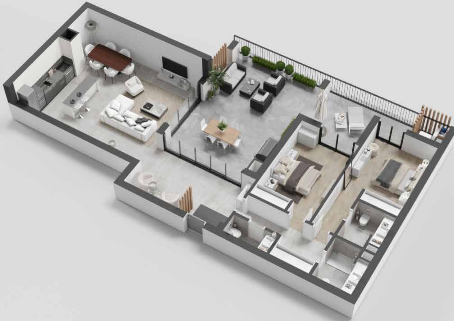
APARTAMENTO TIPOLOGIA T2