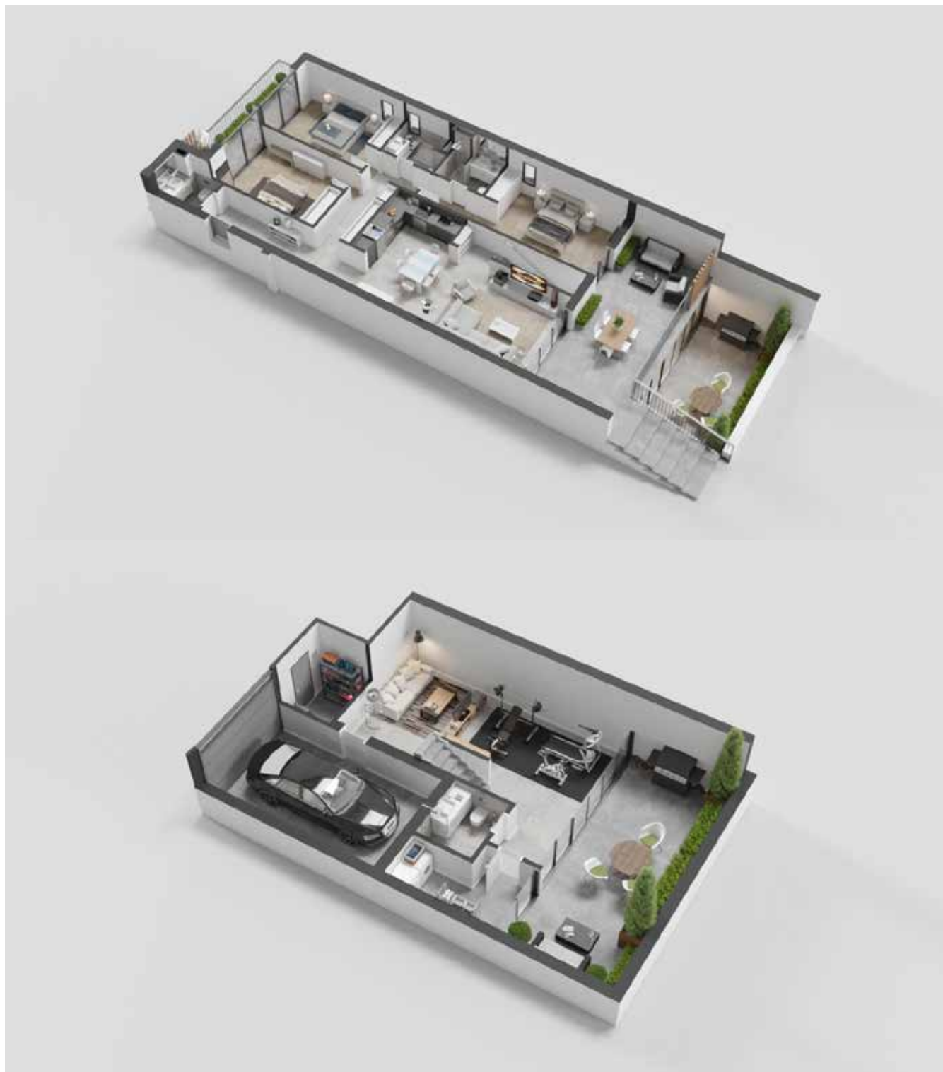
APARTAMENTO TIPOLOGIA T3