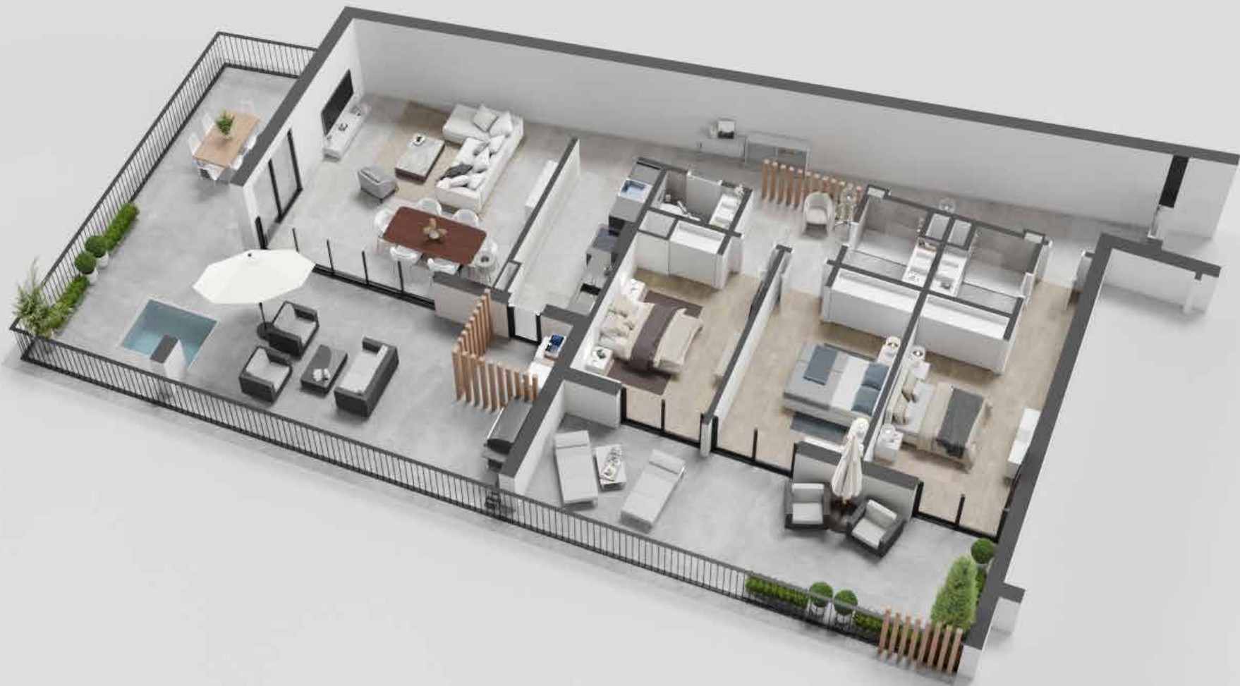
APARTAMENTO TIPOLOGIA T3