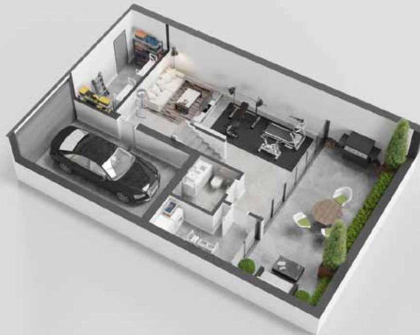
APARTAMENTO TIPOLOGIA T2