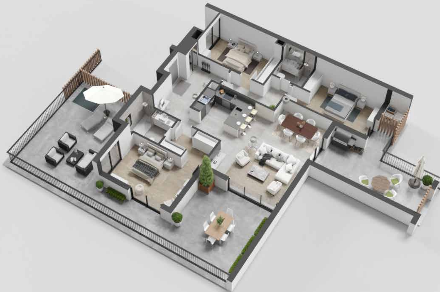
APARTAMENTO TIPOLOGIA T3